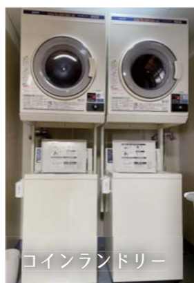
コインランドリー